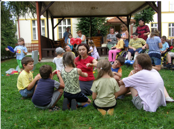
Příprava na vystoupení.

Na rozdíl od běžných návštěv jsou klauni v tomto případě bez kostýmů a červených nosů a předstupují před děti jako civilní osoby. Jejich úkolem tentokrát není rozesmát malé pacienty během klaunské návštěvy, ale udělat z nich svoje spolupracovníky na celý týden. Zdravotní klaun se s dětmi během svých návštěv podělí o část svých dovedností z oblastí kouzlení, žonglování, výroby masek a užívání nejrozličnějších rekvizit. O umění rozdávát úsměv. Děti tak získají jedinečnou možnost nahlédnout do zákulisí práce klauna a zároveň si osvojí celou řadu triků, na jejichž zdokonalování mohou v průběhu týdne pod dohledem klaunů-profesionálů pracovat. A nejen to.