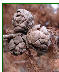
Tisovec dvouřadý - Taxodium distichum

Koruna je úzce kuželovitá. Na místech s vysokou hladinou spodní vody nebo na zaplavovaných půdách vytváří četné kořenovité kolenovité výrůstky (dýchací kořeny), vyrůstající v okolí kmene nad povrch půdy. Červenohnědá, měkká, tenká borka rozpukává v podélných šupinách nebo pásech. Opadavé letky (jehlice) jsou jemné, měkké, světle zelené, čárkovité, bázi sbíhají po větévkách; na podzim se zbarvují bronzově hnědš. Tisovec dvouřadý pochází z jihovýchodních oblastí Severní Ameriky, z bažin od území státu Delaware po Floridu a na západ od Missouri a Texas, kde tvoří rozsáhlé čisté porosty. V kultuře je od roku 1640; pěstuje se i několik kulturů, zpravidla s odlišným vzhledem.