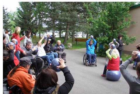
cvičení s overbalem na vozíku v podání