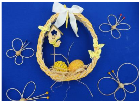
Velikonoční výstavka ergodiílen pavilonu F

Adresa: Hamzova odborná léčebna pro děti a dospělé Košumberk 80 538 54 Luže