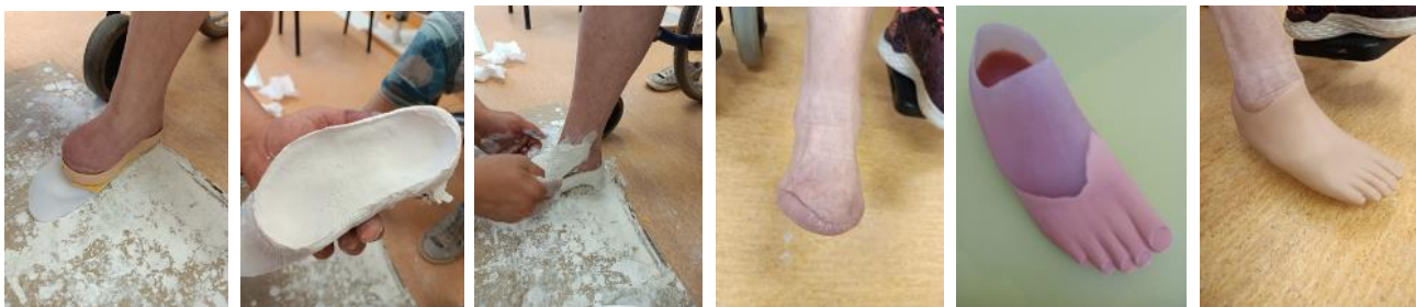
Ing. M. Večeřová Ortopedická protetika

Na základě vystavené žádanky od odborného lékaře, provede ortotik-protetik přesné zaměření chodidla, vyfotí jej a zhotoví sádrový odlitek. Na podkladě tohoto odlitku se vyrobí zkušební protéza, kterou pacient nějakou dobu používá (zachodí). Během této doby může ortotik – protetik protézu přizpůsobovat dle potřeb pacienta. Na základě zkušební protézy se následně vyrobí protéza definitivní, která prakticky umožňuje bezpečnou a přirozenou chůzi.