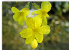
JASMÍN NAHOKVĚTÝ JASMINUM NUDIFLORUM