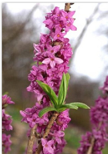
LÝKOVEC JEDOVATÝ DAPHNE MEZEREUM