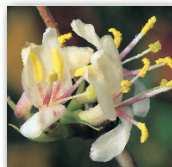
ZIMOZLEZ PURPUSŮV LONICERA X PURPUSII