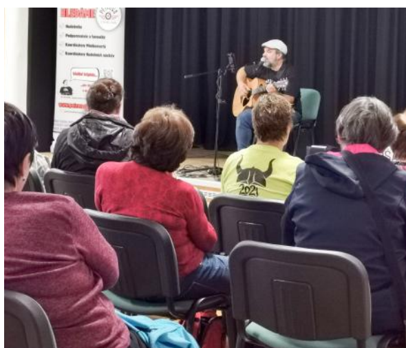
Koncert písničkáře Dušana Bitaly