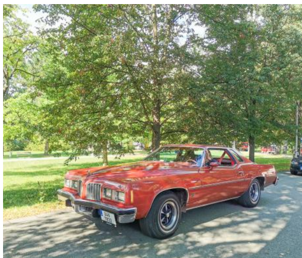
Historická vozidla v areálu Hamzovy léčebny