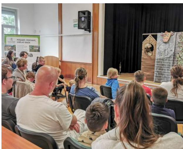
Loutky v nemocnici a jejich Psí pohádky