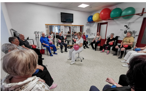
Napříč pavilóny proběhl maraton cvičení v rámci akce MaRS – Týden pohybu pro roztroušenou sklerózu.