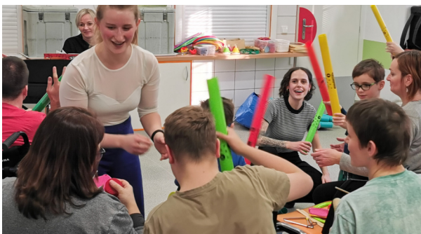
Pacienti z pavilónů B a E si užili hudební workshop s lektorkami ze Základní umělecké školy Vysoké Mýto.